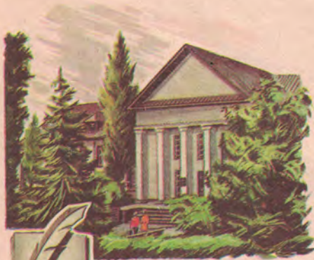
Черкасская область, г. Канев. Музей-заповедник Т. Г. Шевченко Черкаська область, м. Канів. Музей-заповідник Т. Г. Шевченка